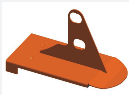
Schneefangstütze Nr. 161 V für Doppelrohr