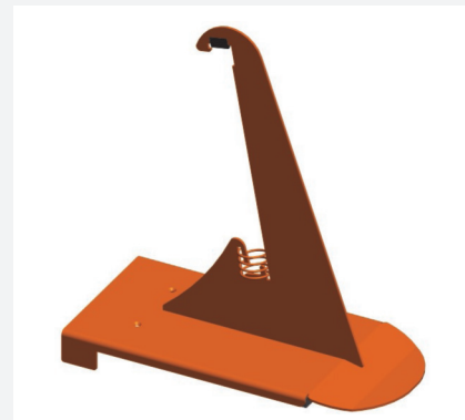
Schneefangstütze Nr. 81 PV 250 mm hoch 100 mm Stuhlhöhe