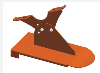
Laufroststütze Nr. 32 V