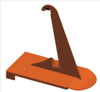
Schneefangstütze Nr. 81 V 250 mm hoch