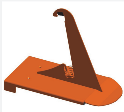
Schneefangstütze Nr. 81 V 200 mm hoch