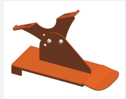
Laufroststütze Nr. 31 V Art.-Nr. 040007 verzinkt Art.-Nr. 040097 beschichtet