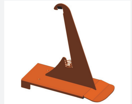
Schneefangstütze Nr. 85 PV 250 mm hoch, 100 mm Stuhlhöhe Art.-Nr. 030460 verzinkt Art.-Nr. 030465 beschichtet