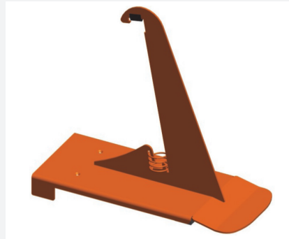
Schneefangstütze Nr. 85 V 250 mm hoch Art.-Nr. 030459 verzinkt Art.-Nr. 030464 beschichtet