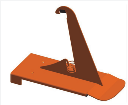
Schneefangstütze Nr. 85 V 200 mm hoch Art.-Nr. 030458 verzinkt Art.-Nr. 030463 beschichtet